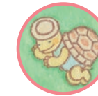
シュウタスさん おしゃべりずき Mr. Shootus Loves to chat