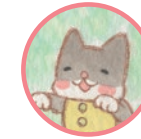
マーチくん しょくにんみならい March An apprentice