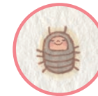
だんごくん ぼうげんか Dango An adventurer