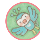
ニロくん たびどり Niro A traveler