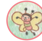
ネッスルちゃん ダンスがとくい Nessel Loves to dancing