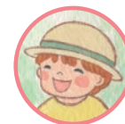
( ) あなたのなまえをかいてね。 Please write your name.

Always, says "GOOD MORNING!" to 'Today', when he wakes up.