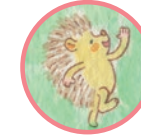
ハリーくん やくそうにくわしい Harry Knows a lot about the herbs