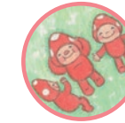
ポノくん オポくん ポポくん きのこさんきょうだい Pono, Opo, Popo Three mushroom brothers