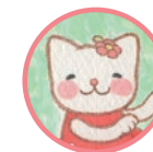
チコちゃん はにかみや Chiko A shy kitty