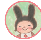
ルーンちゃん ほしよみうさぎ Rune The star reading rabbit