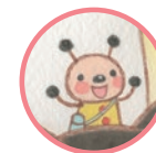
コロちゃん おはなのようせい Koro A flower fairy