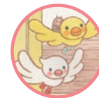
フリップちゃん&フラップちゃん ふたごのことり Flip&Flap A little twin birds