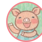
ミルトンちゃん ようぎでまゑむき Milton Happy and optimistic piggy