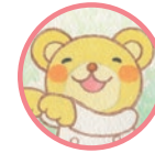
ひまわりさん りょうりにん Mr. Himawari A chef