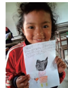
ネパール スンダリジャル