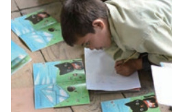
ネパール ガンガジ