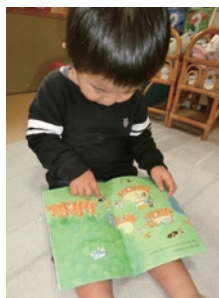
福島県白河市 たんぼぼサロンさん