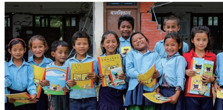
ネパール カルジャンハ

合計141,200冊を印刷製本。2011年から毎年東日本に、2015年からネパールに、2016年から熊本にお届け。