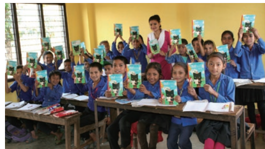
ネパール ダディン

合計141,200冊を印刷製本。2011年から毎年東日本に、2015年からネパールに、2016年から熊本にお届け。