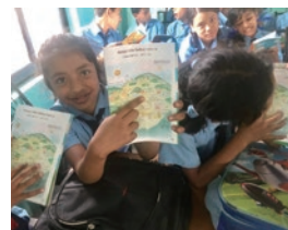
ネパール カトマンズ