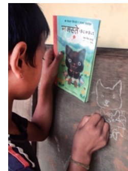
ネパール ダディン