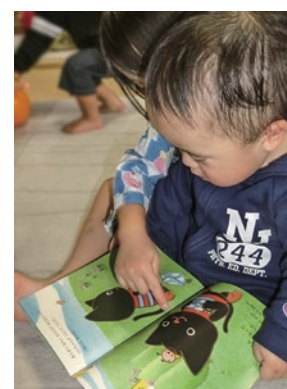
福島県白河市 たんぼぼサロンさん